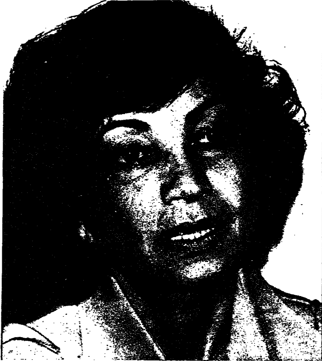
الاميرة اشرف : الثمرة المعجوز

اولادها وترينهم ؟ يقول احد الذين زاواروا الشهبانو ان السنة الواضحة عليها هو القلق والتوتر .